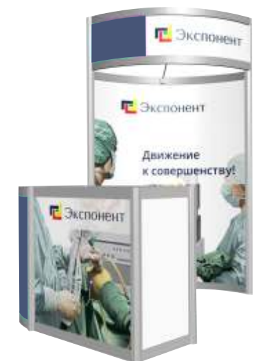
Стенд со стойкой ресепшна