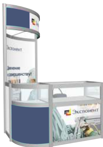
Стенд с витриной