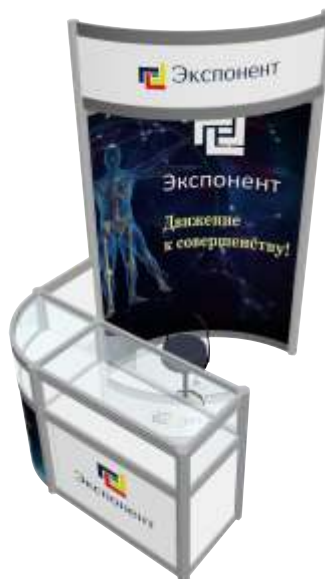
Стенд со стойкой ресепшна

Технический организатор ООО «Ивентариум», +7 (925) 491-74-11, mail@eventarium.pro