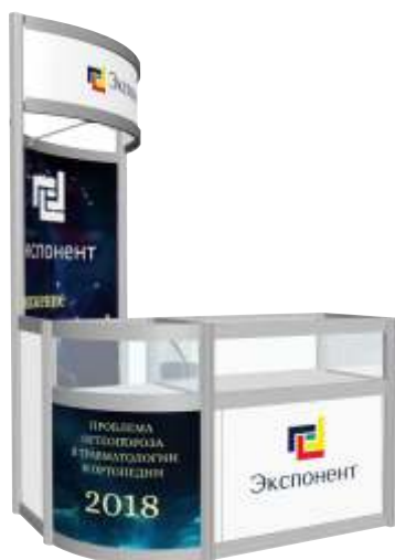
Стенд с витриной