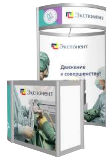
Стенд со стойкой ресепшна