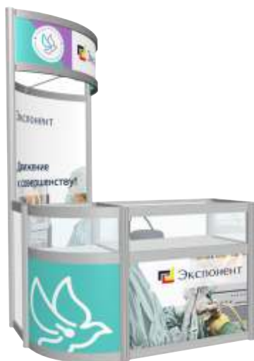
Стенд с витриной