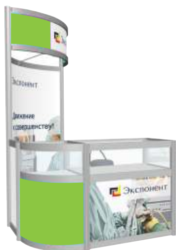
Стенг с витриной