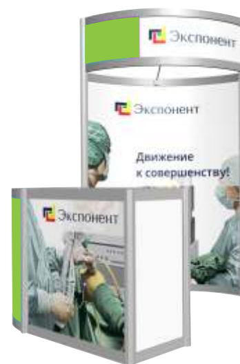
Стенг со стойкой ресепшна