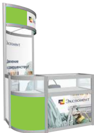
Стенг с витриной